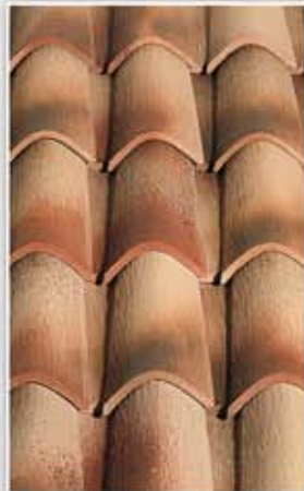
Serenissima Hand Made Type